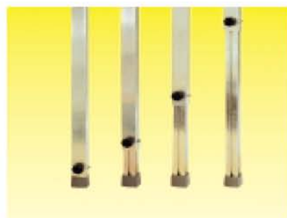
Вставные ножки 40 мм. Телескопические