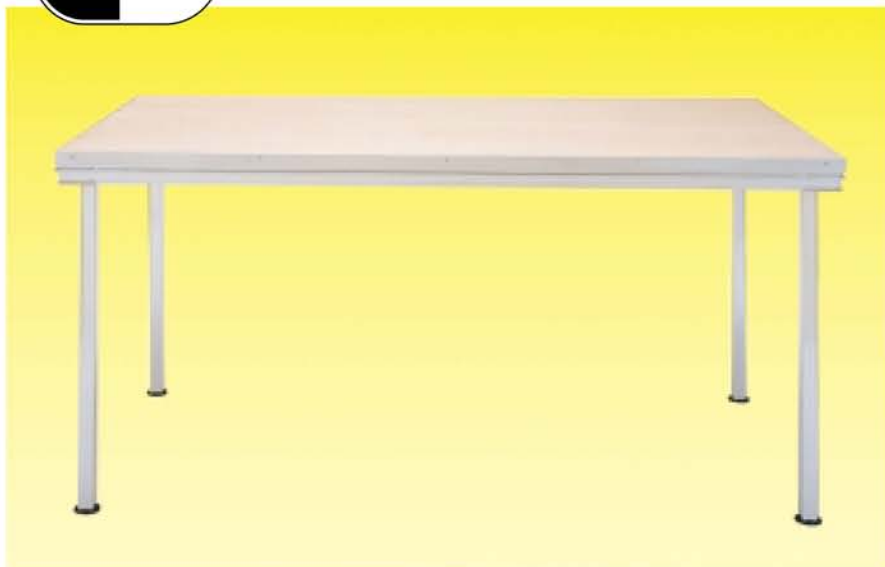
NIVOflex®-Light. Идеально подходит для нестандартных высот, размеров и специальных форм.