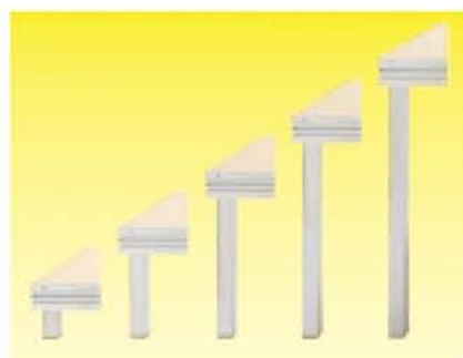
Вставные ножки 40 мм. Длины фиксированные.