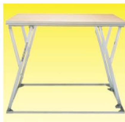
Версия NIVOflex®-Elefant для высот до 150 см