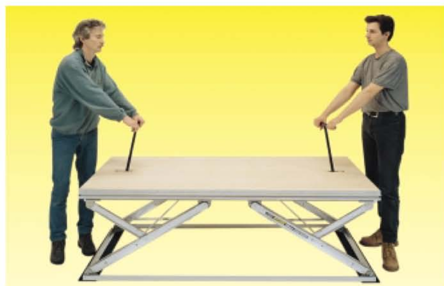
Версии NIVOflex®-Comfort и NIVOflex®-AirStage для стационарного монтажа обслуживаются сверху. Смотри брошюру «Изменение пола зала, вручную».

NIVOflex®-Professional позволяет смонтировать станки с общей высотой друг над другом до 200 см. (Статические испытания согласно стандарту DIN 4112).